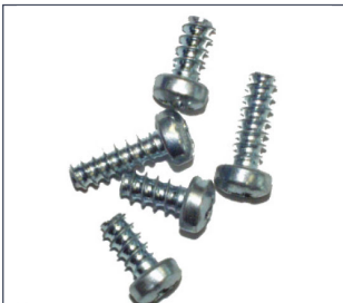
EJOT Delta PT ® Schraube

Achtung: Die Delta PT ® -Schrauben besitzen kein metrisches ISO Regelgewinde nach DIN 13, daher sind sie nur für die Kunststoff-Einlegeile verwendbar.