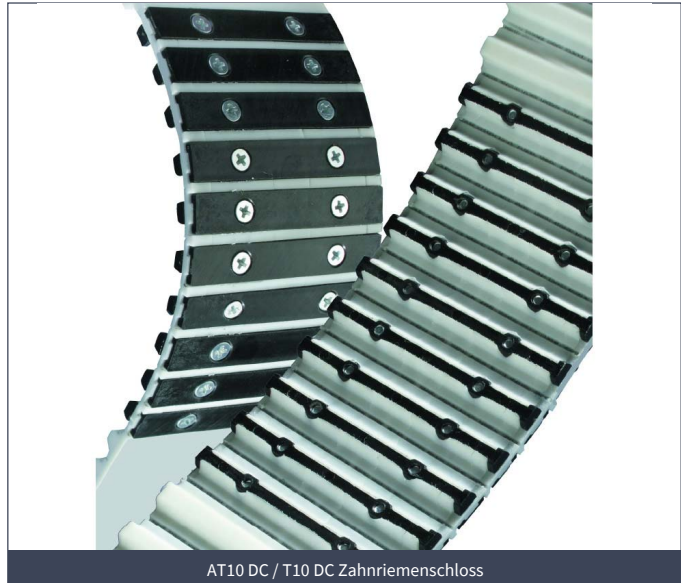
AT10 DC / T10 DC Zahnriemenschloss

Auch ein Einsatz als „Notlaufzahnriemen“ zum Überbrücken von Stillständen nach Funktionsstörungen und damit eventuell verbundenen Riemenausfällen ist möglich. Bei der Verwendung des Schlosses bei Zahnriemen mit aufgeschweißten Profilen ist ein Mindestprofilabstand von 100 mm zu berücksichtigen.